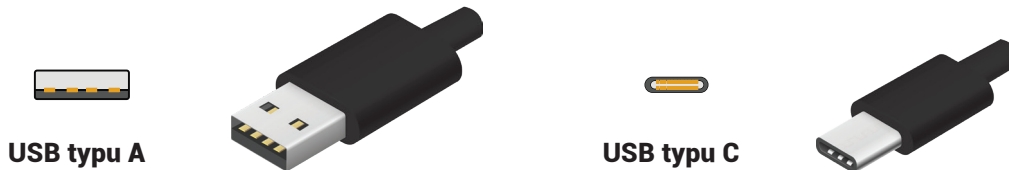
USB typu A

Opakowanie zawiera kable zarówno do USB A jak i USB C, aby zapewnić kompatybilność z jak największą liczbą urządzeń. Sprawdź port Twojego komputera. Porty USB typu A są prostokątne, natomiast USB typu C mają pociągły, owalny kształt. Wybierz kabel odpowiadający Twojemu urządzeniu. Podłącz jeden koniec przewodu do Twojego sprzętu, drugi do Pro Elite.